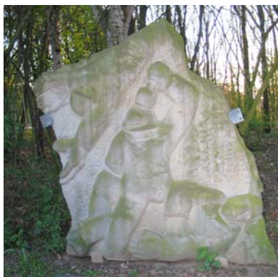
Kunst im Stadtpark

Strecke: In Langenhagen in der Görlitzer Straße gradeaus durch den Stadtpark bis