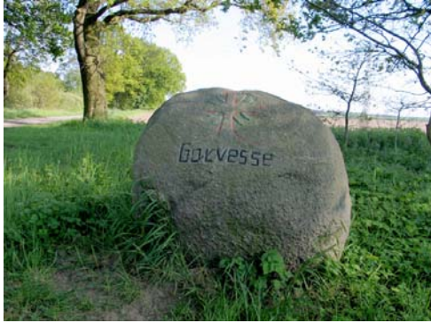
Am Erinnerungsstein für das untergegangene Garvesse entlang