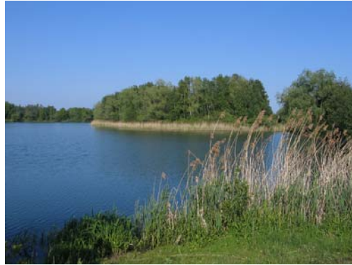
See bei km 25,5

Extra: In Steinwedel befindet sich in der Ramhorster Straße nahe der Einmündung Koppelweg ein Bambusinformationszentrum www.bambus-info.de .