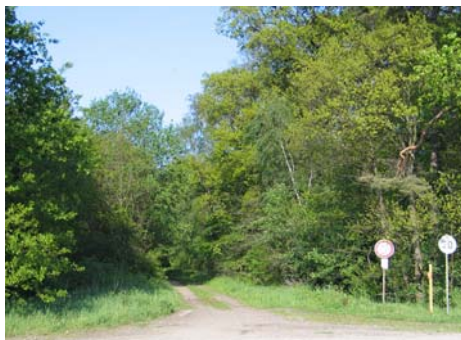
In den Heister hinein

Start: Beispielsweise ab Krankenhaus Lehrte in der Manskestraße/Steinstraße.