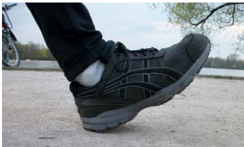
Die Zehenspitze anziehen!