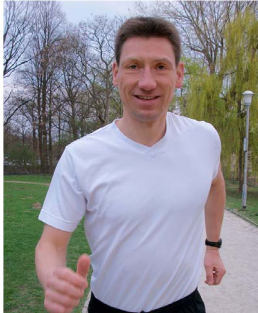
...seitlich vom Körper