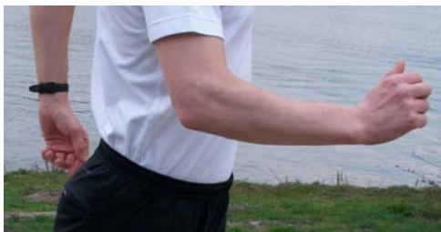
Die Arme schwingen unverkrampft mit

Damit werden weitere Muskelgruppen aktiviert und gekräftigt.