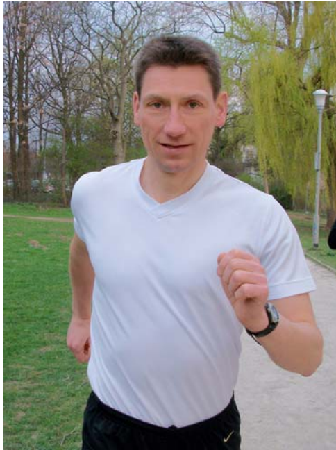
Die Arme schwingen ...